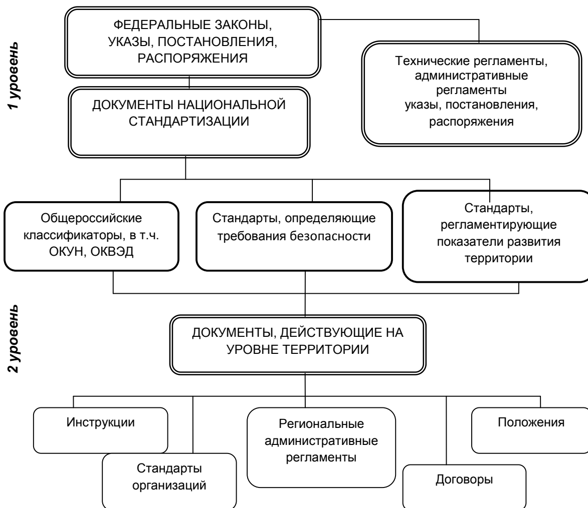
Рис. 2. Перспективная структура нормативного регулирования устойчивого развития административно-территориальных образований

Таким образом, проведение работ по стандартизации в целях обеспечения на меж-