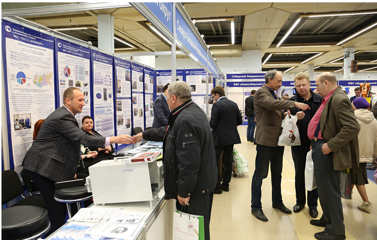
Экспозиции Центров стандартизации и метрологии на выставке «MetroExp-2016»

и руководитель Федерального агентства по техническому регулированию и метрологии (Росстандарта) Алексей Абрамов.